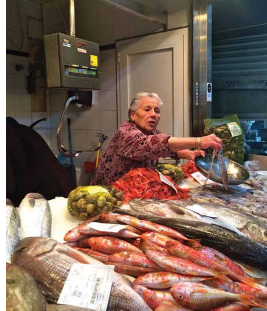
De sælges fisk i alle afskygninger på Santa Catalina markedet.

cinske delikatesser hos Gourmet Sardegna SRL, chokolade hos Chocolat Factory, spanske kædebutikker som Zara og Mango og så er der Kling - Palmas sejeste butik med masser af lækkert tøj til ham og hende fra Rick Owens, Yohjii Yamamoto og lækre accessories og duftlys. En god strandtaske i siv fås flere steder med fine læder detaljer og er et must til stranden og også en god souvenir.