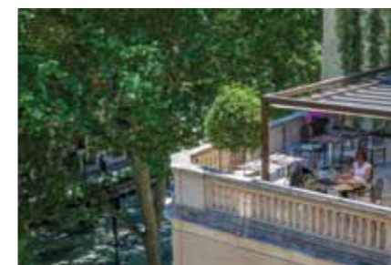
Terrassen på Hotel Can Alomar.

Det mest spændende køkken og den skønneste restaurant er De Tokio a Lima og er beliggende på terrassen på hotellet Can Alomar. Her er der fokus på gode, rå ingre-