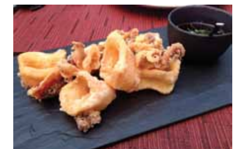
Eksotiske lækkerier på Restaurant De Tokio a Lima.