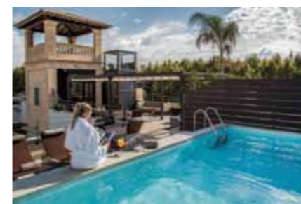
Pool på tegterrassen.