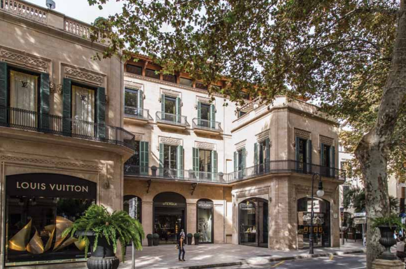
Hotel Can Alomar.