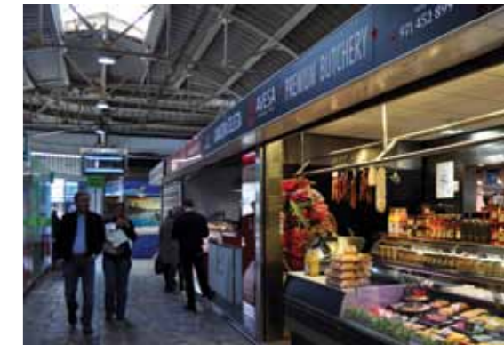
Santa Catalina markedshal.