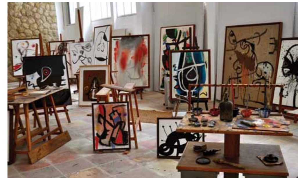
Miro Museet i Palma.

dienser og en fusion af det japanske køkken, der møder det peruvianske og diverse middelhavsretter med et twist. Nyd et glas Rigol, som er en fantastisk cava fra Barcelona, mens du nyder udsigten fra terrassen over smukke Paseo del Borne. Hvis man vil bo centralt og skønt i Palma er