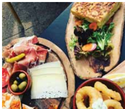
Majorcinske specialiteter på La Cocotte.

Hvis man kører op til Deià, der er en af de skønneste byer nordpå langs kysten ligger hotellet Ca's Xorc, som er et af de mest romantiske og stille spots på Vestmallorca i Sollér dalen med store haver, terrasser og