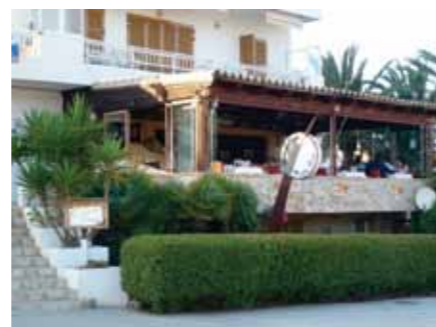
Media Luna med udsigt over marinaen.

fisk, lam, oliven, mandler og citrusfrugter. Tapas er ej at forglemme og helt sublimt på Bon Profit.