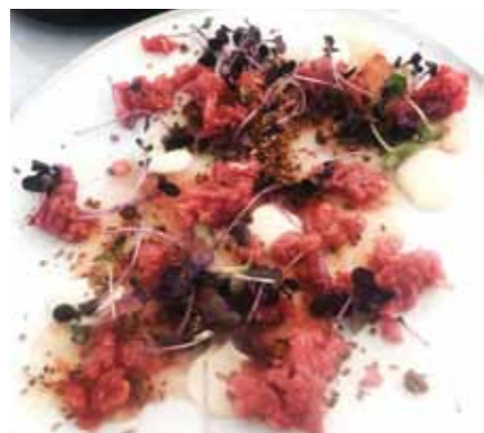
Wilson's tartar anretning.