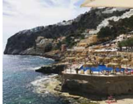
Beach club Gran Follies.

et sjovt sted at bo og hotellet holder nogle gedigne skybar fester med god live musik. Konceptet 'Burger meets gin' er en festlig event her hver fredag i sommerhalvåret, som er amerikansk køkken der møder en engelsk klassiker.