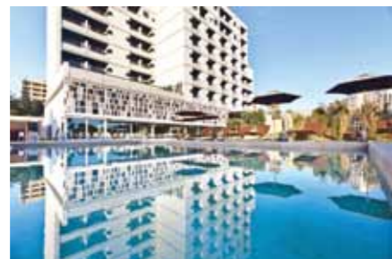
Hotel Od Port Portals.