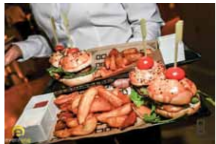
Burger menuen hos Od Port Portals.