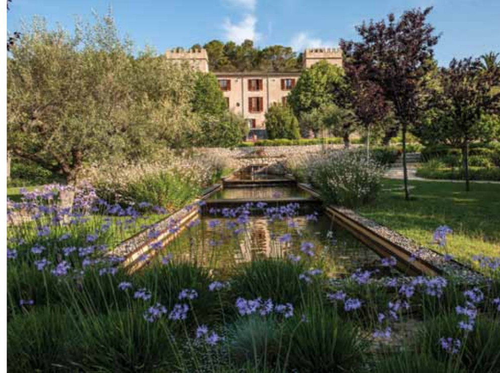
Den smukke have på Castell Son Claret.

Et af øens bedste spaer ligger også her Bellesa de Claret, hvis man vil forkæles lidt.