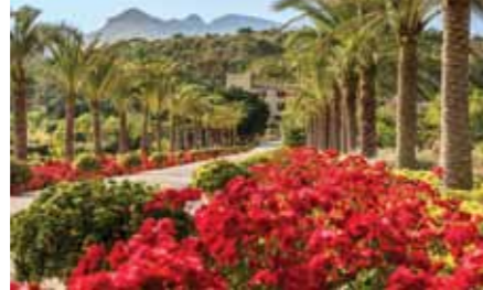
Imponerende flot allé på vej op til luksushotellet Castell Son Claret.