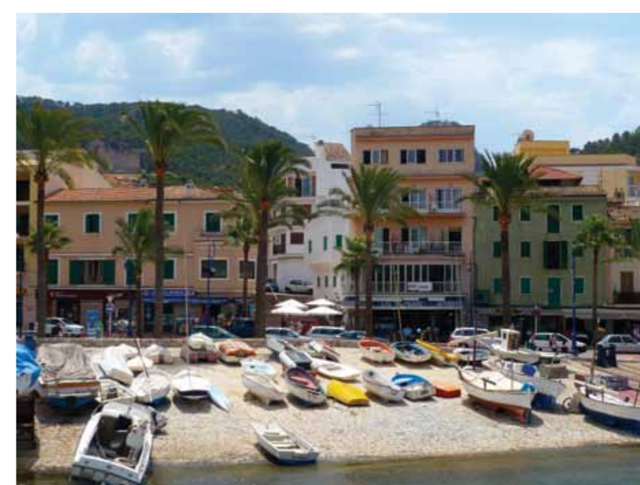
Promenaden i Port d'Andratx.